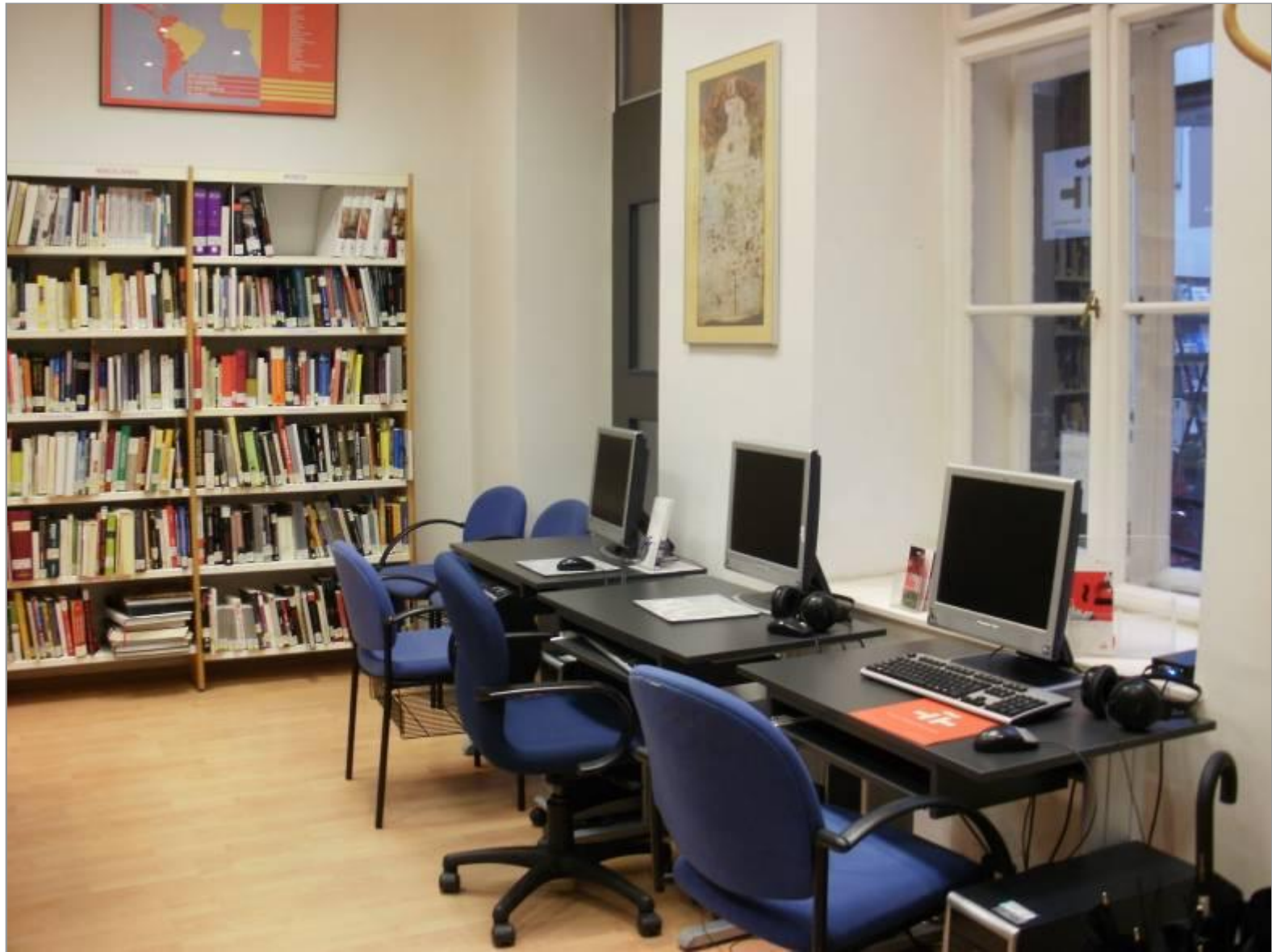
Dirección de Gestión Comercial y Desarrollo de Producto