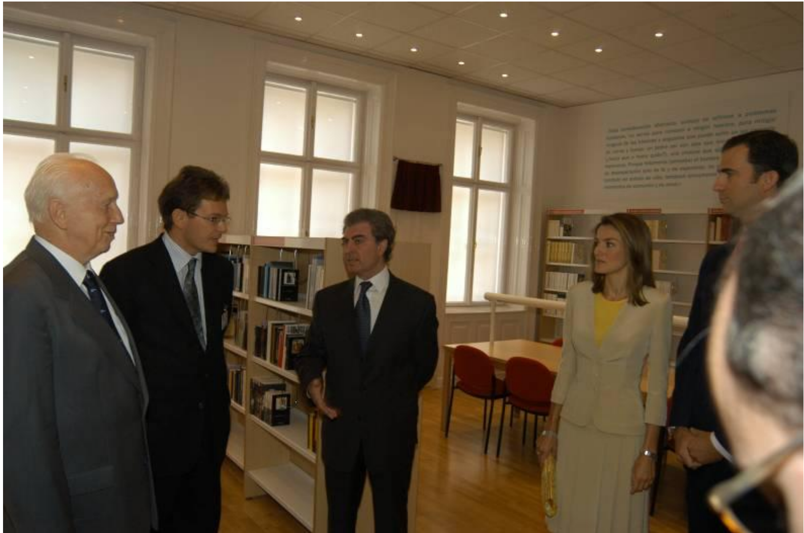
Inauguración de la Biblioteca . Año 2005