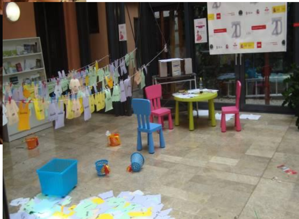
18 de junio de 2011. Día del Español. Actividades en la Biblioteca. “La búsqueda del tesoro” y “Palabras al sol”