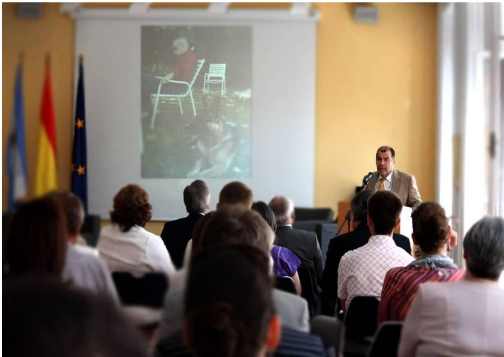
24 de junio de 2011. Homenaje a Ernesto Sabato Mesa redonda, exposición fotográfica y bibliográfica.