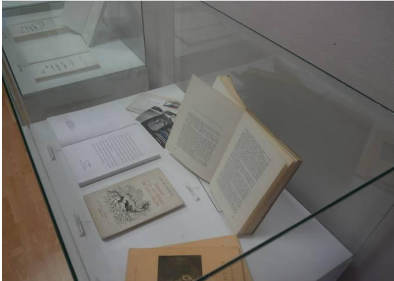
24 de junio de 2011. Homenaje a Ernesto Sabato Exposición de primeras ediciones de sus libros.