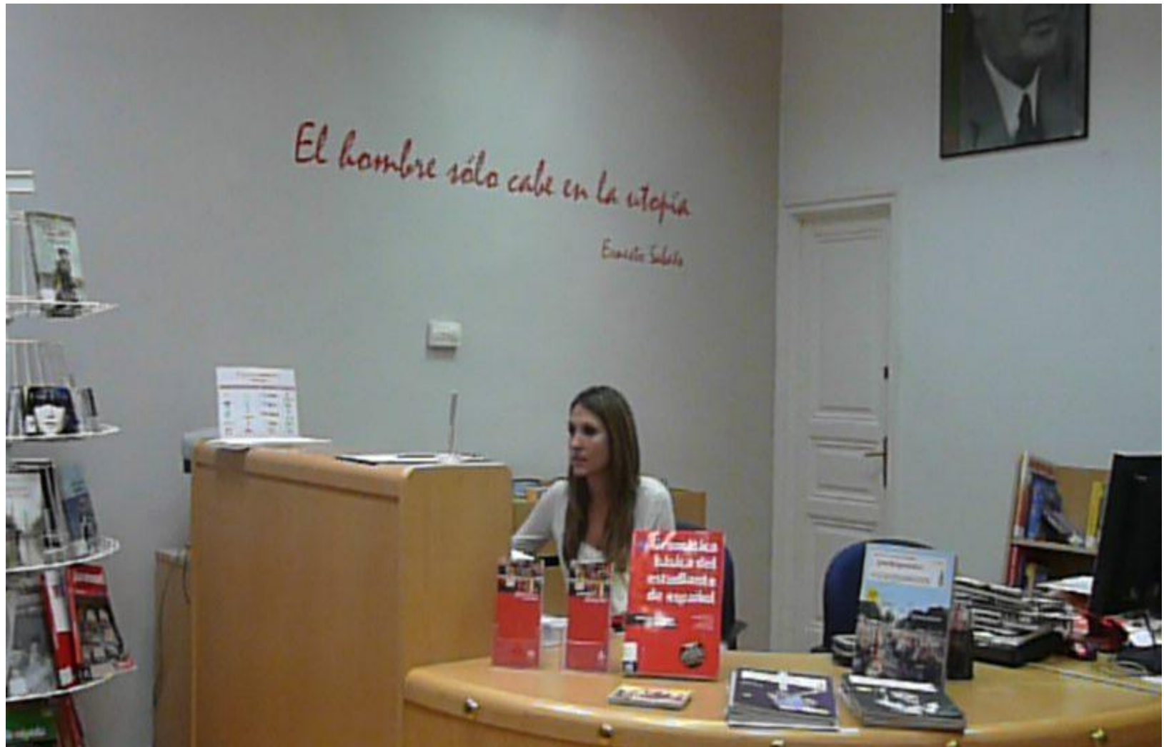
Mostrador de préstamo